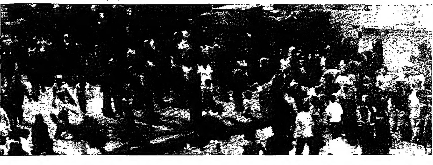
مظاهرون في القاهرة يوم الخميس الماضي

انتظار إعادة الانتاج جميع مصوغاتها عمل الشير من إعادة الانتاج الكامل للانصاف التالية ستاندر حشيت - موسيليا - ستوفية حشيت والوسيلوم - ساردي « لوقس » حشيت